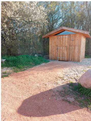
Eksempel på billede af adgangsvej fra hovedruten med underlag.