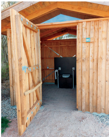
Eksempel på billede af indgang med underlaget inde og ude og med døren åbnet op i 90 graders vinkel.