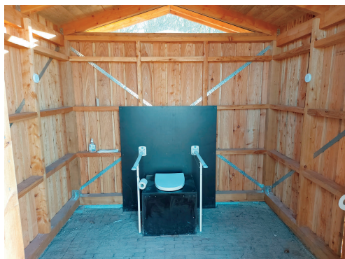
Eksempel på billede af indretningen af rummet, toilettet og hvor man kan se, at der er armstøtter.