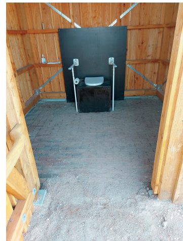
Billede af overgangen i belægningen mellem inde i toilettet og udenfor.